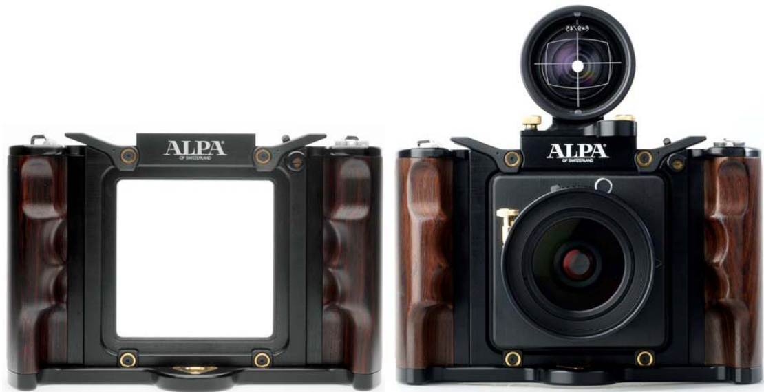
Abb. 1: ALPA 12 WA Kamerakörper von vorne (links) und mit angesetztem Sucher und Objektiv (rechts)

Bei Verwendung eines Objektivs mit einem Bildkreis, der größer ist als das Aufnahmeformat, kann das Objektiv so auf der Auflageplatte montiert werden, dass die Hauptpunktage um einen festen Betrag verschoben ist. Man erhält damit eine Kamera mit fixem Shift, ähnlich den früheren Aufnahmekammern P31 und P32 von WILD Heerbrugg.