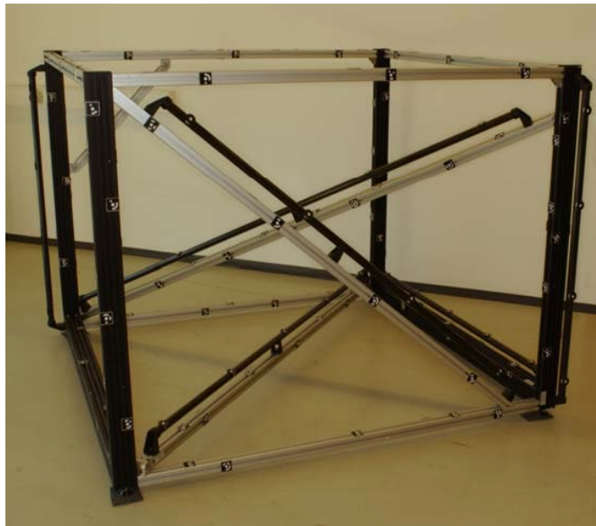
Abb. 5. Testfeld bei AICON 3D Systems, Braunschweig

Das für diesen Bericht verwendete Testfeld wurde bei der Firma AICON 3D Systems in Braunschweig installiert (Abb. 5). Es enthält insgesamt 173 kreisförmige Zielmarken, 33 davon befinden sich auf sieben kalibrierten Maßstäben. Die Längenmessabweichungen werden an 58 Teststrecken ermittelt.