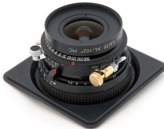
Abb. 2: Schneider Apo-Digital 5.6/35 mm XL mit Copal 0 Verschluss

Besonders interessant für die digitale Fotografie sind die Apo-Digitare der Jos. Schneider Optische Werke GmbH, Bad Kreuznach. Diese Objektive sind für digitale Bildsensoren optimiert und weisen einen Bildkreis zwischen 60 und 120 mm auf. Sie besitzen ein hohes Auflösungsvermögen bis zum Bildrand. Das Farbspektrum ist bis in das nahe Infrarot korrigiert. Brennweiten zwischen 24 und 210 mm sind verfügbar. Ein Bildkreis von 60 mm deckt bereits die Bildfläche üblicher digitaler Rückteile ab. Für diesen Test wurde mit einem Apo-Digital 5.6/35 mm XL Weitwinkel fotografiert (Abb. 2). Das Objektiv besitzt bei Blende 11 einen Bildkreis von 90 mm.